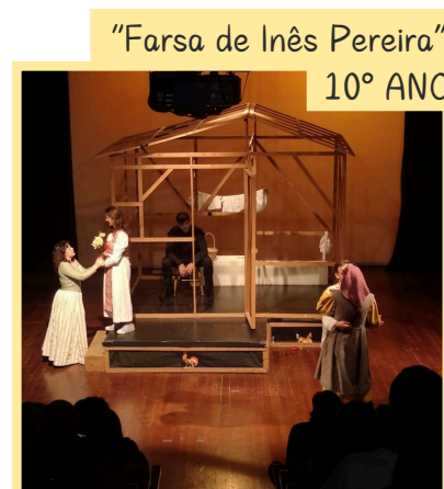
“Farsa de Inês Pereira” 10º ANO