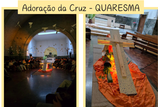
Adoração da Cruz - QUARESMA