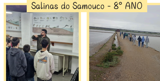
Salinas do Samouco - 8º ANO