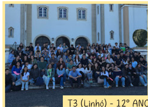
T3 (Linhó) - 12º ANO

Em nome do Pai, do Filho e do Espírito Santo