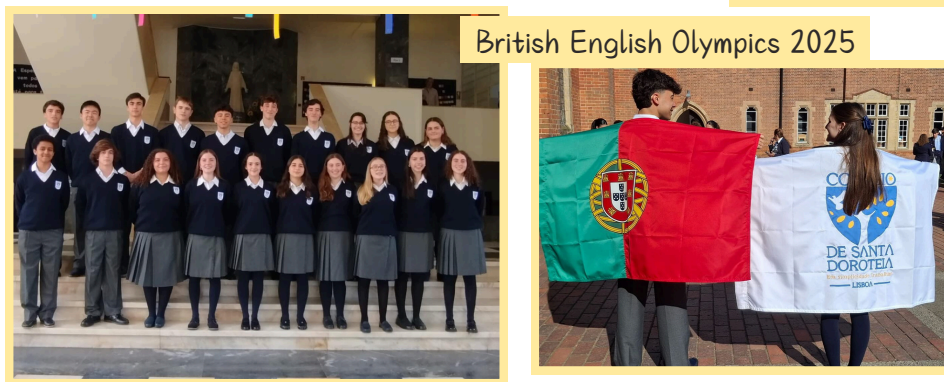
British English Olympics 2025