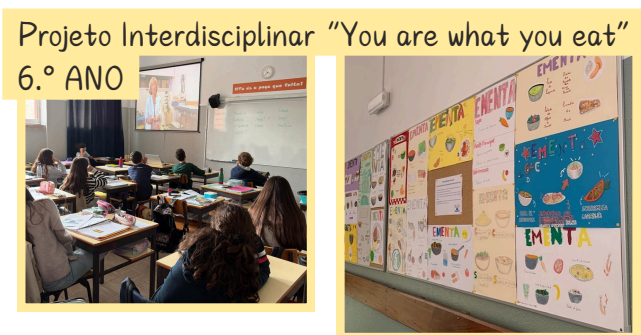
Projeto Interdisciplinar “You are what you eat” 6.º ANO