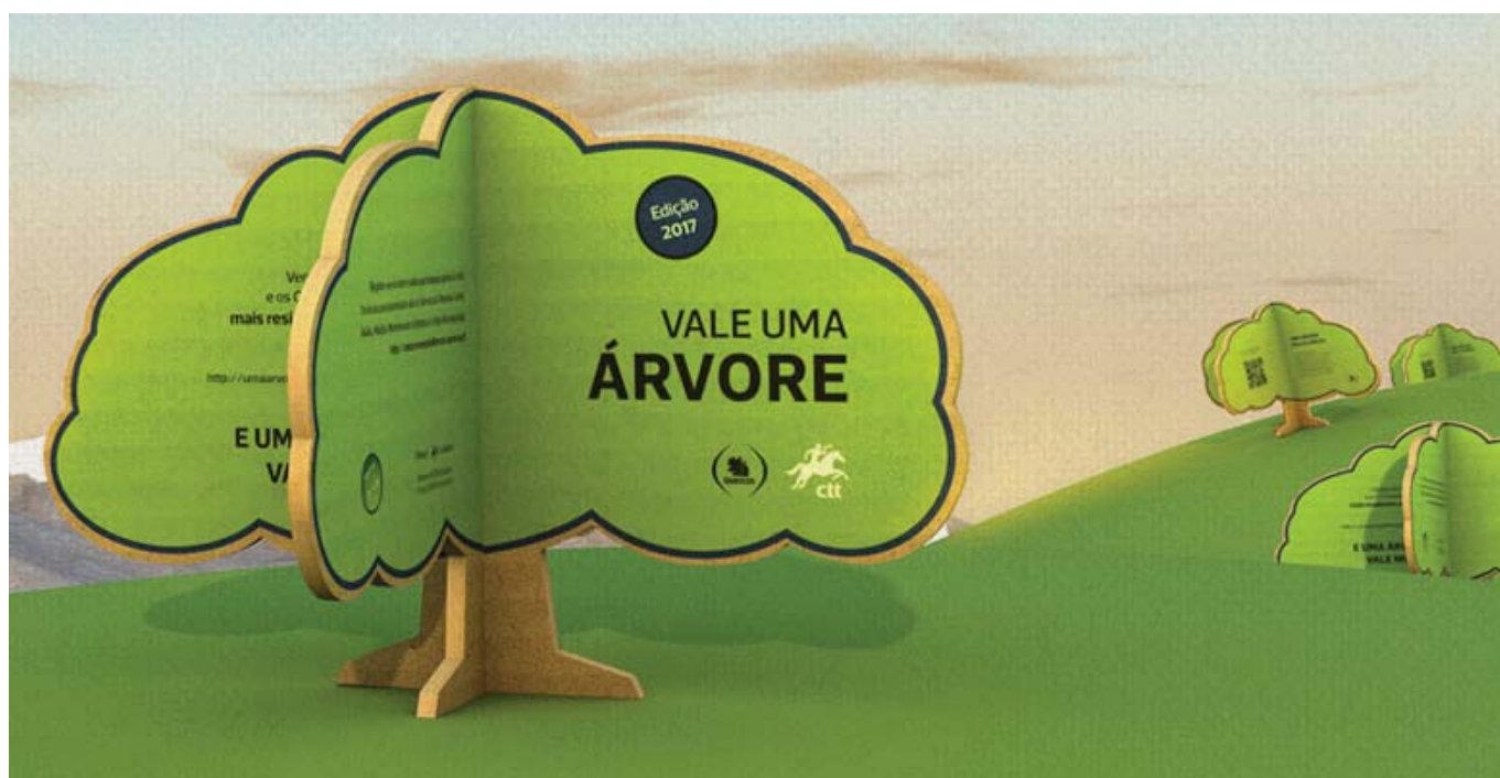
CAMPANHA “UMA ÁRVORE PELA FLORESTA” - CTT - EDIÇÃO 2017

Em nome do Pai, do Filho e do Espírito Santo.