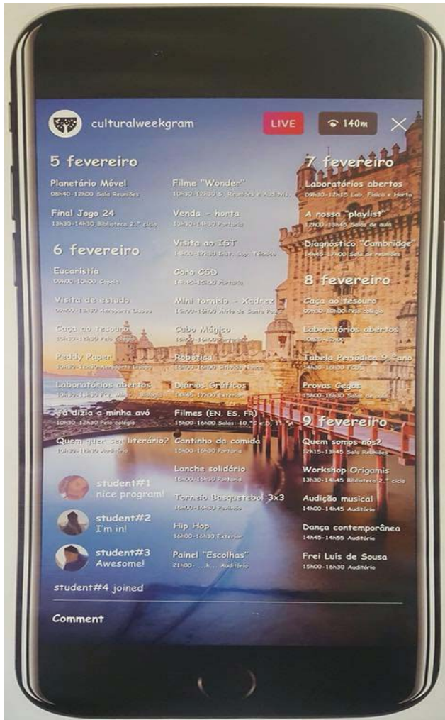
SEMANA CULTURAL 2018