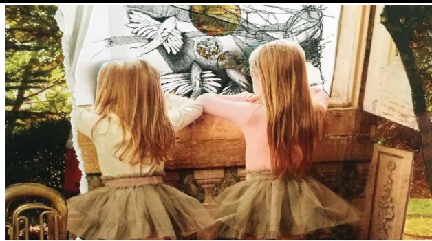
Congresso Português Arte Terapia - Fundação Calouste Gulbenkian