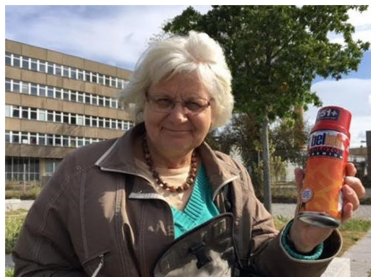
A avó graffiter que apaga mensagens de ódio

Em nome do Pai, do Filho e do Espírito Santo.