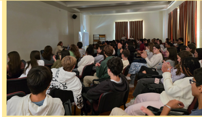
Projeto "Ser Vida" - 9.º ANO