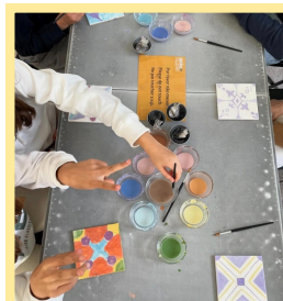
Museu do Azulejo 8.º ANO