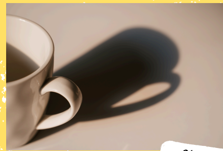
Objeto e sombra