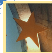
Roteiro Pessoano 12.º ANO