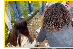
T3 - 9ºAno